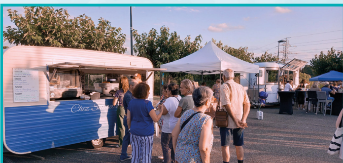
CHEZ SAM ET SCOOBY (PLATS MIJOTÉS)