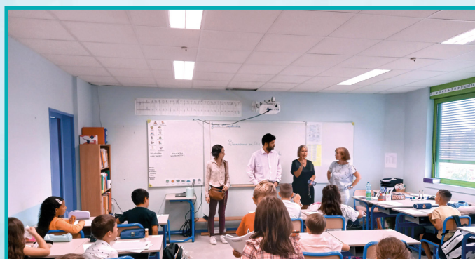
La nouvelle classe (13 ème ) de Mme Gauche toute équipée