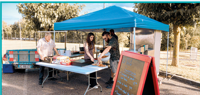
LA TABLE GOURMANDE (GASTRONOMIQUE)