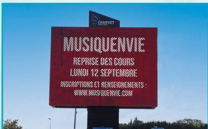
RN 21 / ROND-POINT DU CHÊNE ENTRÉE-SORTIE