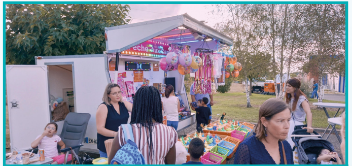
AMÉLIE (BONBONS, BARBE À PAPA)