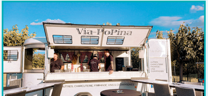
VIA POPINA (HUÎTRES, SAUCISSES)