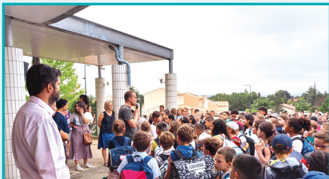
Une rentrée sereine

La ville de Foulayronnes maintient une relation privilégiée avec les deux écoles de la commune. C'est tout un travail d'écoute, de réflexion et de dialogue avec les enseignants, les parents et les enfants, qui s'est installé depuis quelques années maintenant.