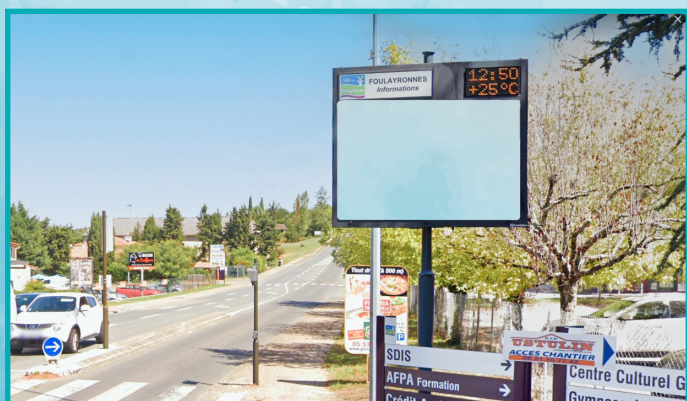
AV. DU CAOULET ENTRÉE - D13 (DÉBUT 2023)