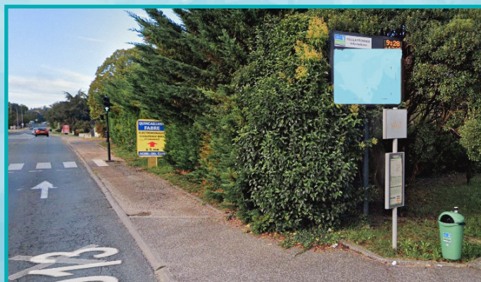
AV. DU CAOULET SORTIE - D13 (DÉBUT 2023)

Directeur de la publication : Bruno DUBOS • Responsable de la publication : Clément COURTIES