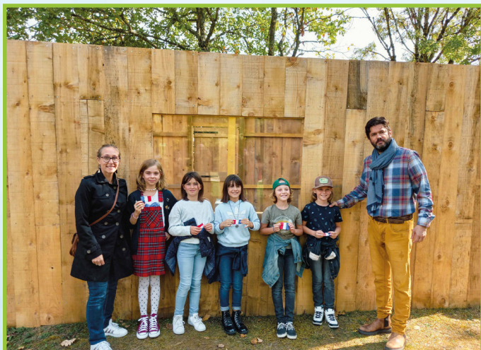
Inauguration du rucher le samedi 8 octobre

Les actions de la municipalité dans le cadre environnemental, économique et social prennent en compte les principes fondamentaux du développement durable et de l'écologie qui sont essentiels pour notre commune.