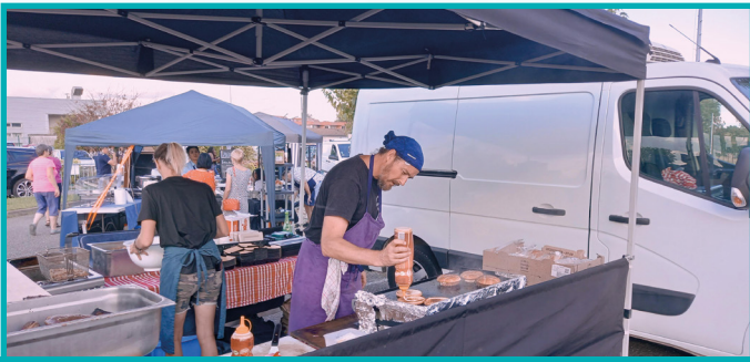
LE CAOULET (TRADITIONNEL)