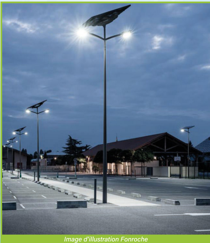
Image d'illustration Fonroche

Les travaux seront réalisés par les services de l'Agglomération et le matériel photovoltaïque sera fourni par la société Fonroche, entreprise locale et leader sur le marché mondial.